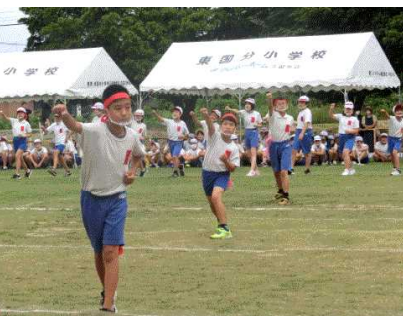
5、6年生「応援合戦」より

毎年、運動会を飾る応援合戦も5、6年生での実施となりました。6年生にとっては、最後の運動会であり、応援合戦はどうしても実施したいという子どもたちや担任の願いからこのような形で実施しました。感染拡大防止対策を踏まえながら、いつもの応援合戦を子どもたちと担任で工夫しました。たくさんのアイデアが見られる応援合戦になりました。